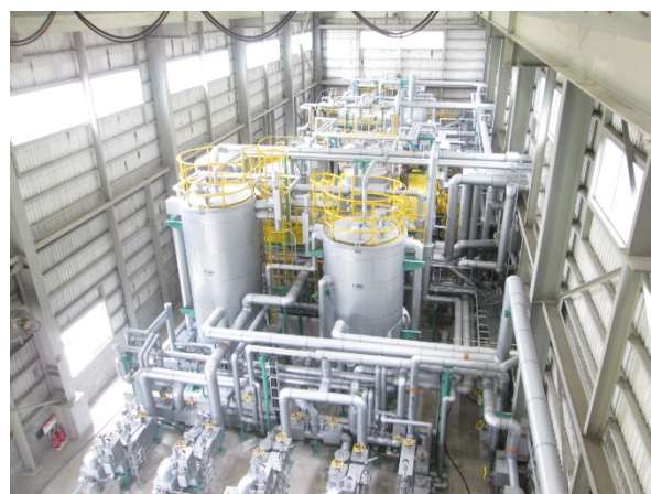
原油処理設備全景