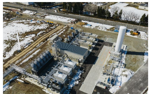
エネルギーセンター空撮写真